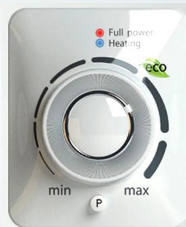
внешний вид панели управления