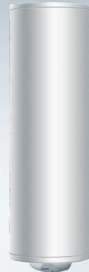
EWH 200 R