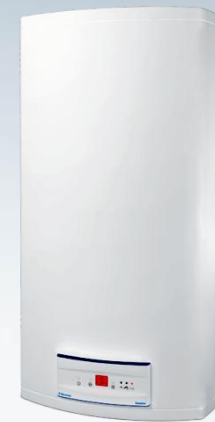
EWH 80 Digital EWH 100 Digital