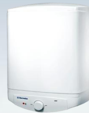
EWH 15 S