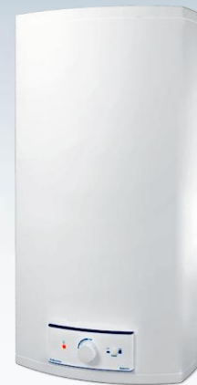
EWH 30 SL EWH 50 SL EWH 80 SL EWH 100 SL EWH 120 SL EWH 150 SL